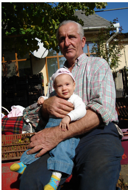
Lányom az Apukámmal